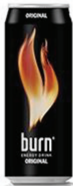
Energidryck, Burn 1 glas (2 dl) = 9 sockerbitar