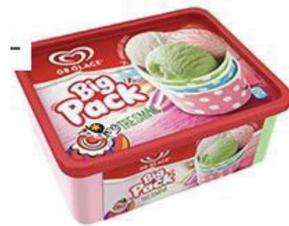
Glass 1 portion (2 dl) = 7 sockerbitar