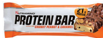
Energibars 1 hel bit = 7 sockerbitar