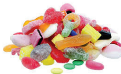
Smågodis 20 bitar smågodis = 16 godisbitar