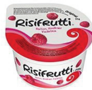
Risifrutti 1 burk (2 dl) = 6 sockerbitar