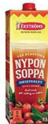
Nyponsoppa 1 glas (2 dl) = 10 sockerbitar