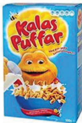
Kalaspuffar 1 port (30g) = 5 sockerbitar