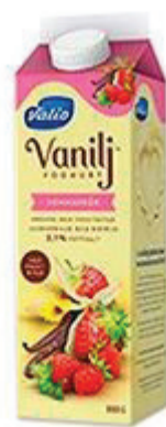
Yogurt vanilj 1 portion (2 dl) = 6 sockerbitar