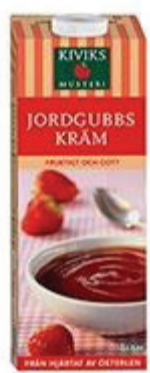
Jordgubbskräm 1 glas (2 dl) = 11 sockerbitar