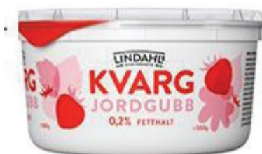
Kvarg, jordgubb 1 portion (2 dl) = 8 sockerbitar