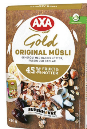
Müsli nyckelhålsmärkt 1 portion (2 dl) = 0 sockerbitar