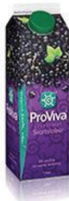
Proviva, svart vinbär 1 glas (2 dl) = 8 sockerbitar