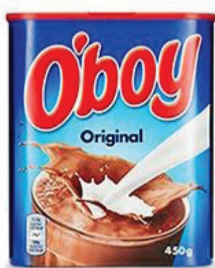
Chokladdryck, O'boy 1 glas (2 dl) = 5 sockerbitar