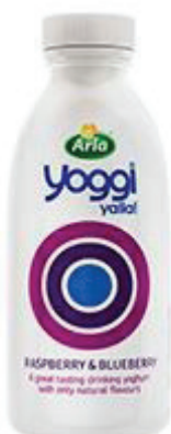
Yoggi Yalla 1 glas (2 dl) = 7 sockerbitar