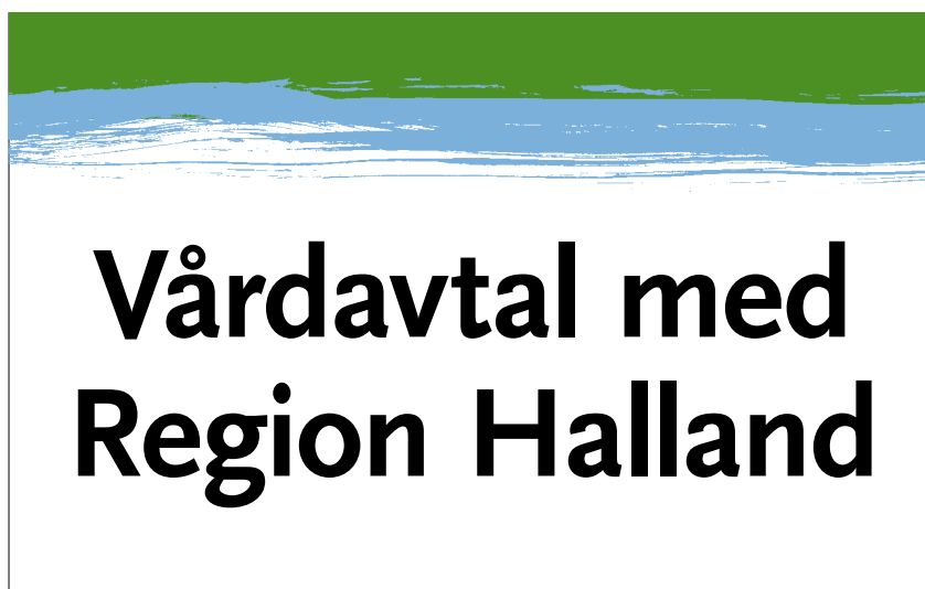
Vårdavtal med Region Halland-symbolen

En särskild skylt och en affisch med denna information, finns som komplement till symbolen.