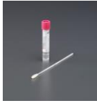
Provtagningsrör: E-swab rosa kork