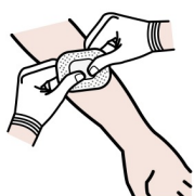
Vi sätter bedövning i armvecket