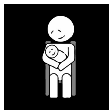
Barnet får sitta i ditt knä.