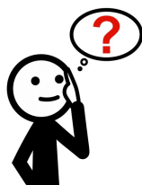
Varför ska vi ta provet