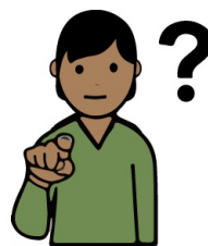
Har du några frågor

Materialet är framtaget av Centrala barnhälsovårdsteamet Region Halland.