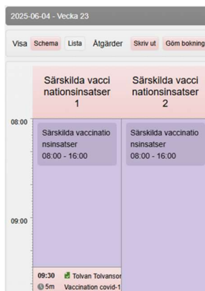
Vy enligt Schema